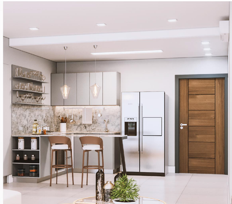
Las imágenes (renders) proporcionadas son únicamente referencias y pueden variar en cualquier momento. Los elementos decorativos no están incluidos en este proyecto.