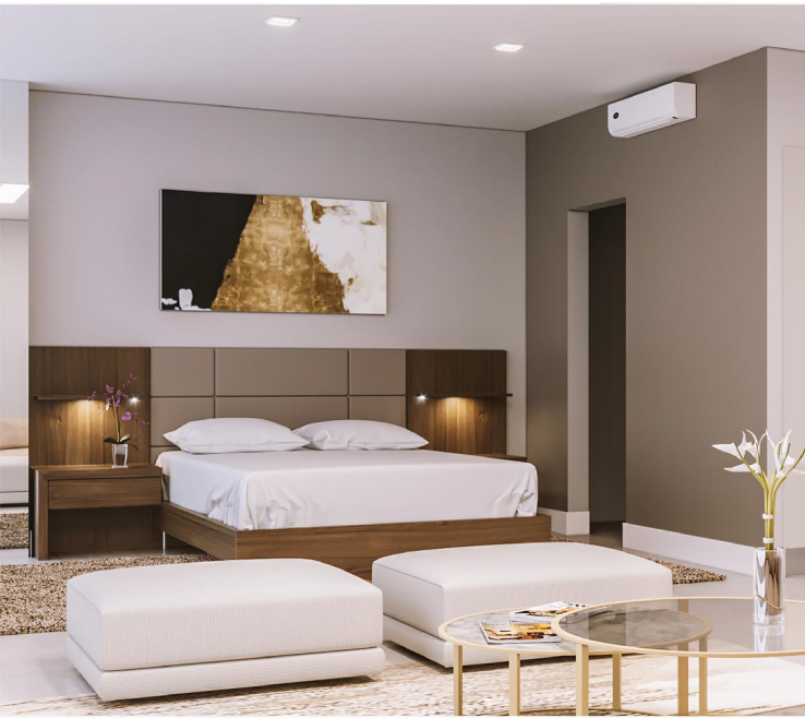
Las imágenes (renders) proporcionadas son únicamente referencias y pueden variar en cualquier momento. Los elementos decorativos no están incluidos en este proyecto.