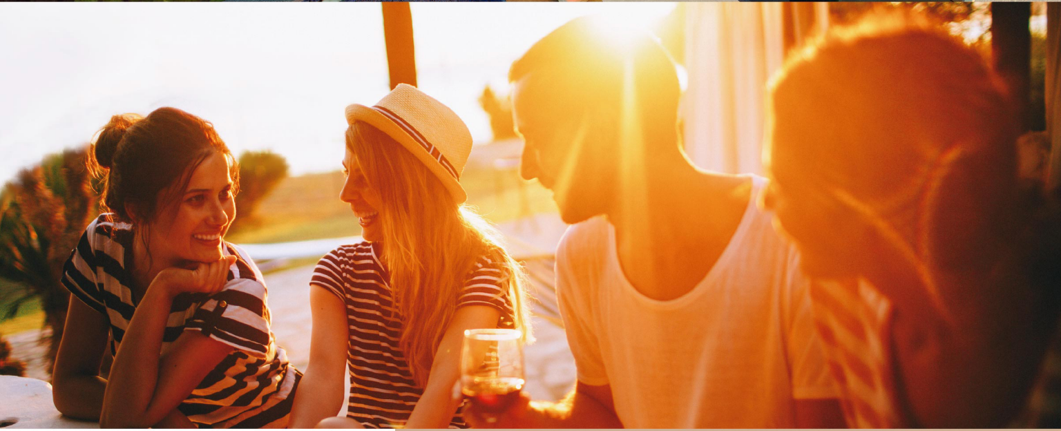
SKY DECK / ROOFTOP TERRACE